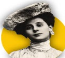
А́нна Па́вловна Па́влова