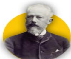
Пётр Ильи́ч Чайко́вский