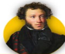
Алекса́ндр Серге́евич Пу́шкин