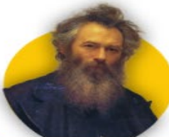
Ива́н Ива́нович Ши́шкин