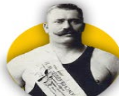
Ива́н Васи́льевич Подду́бный