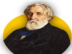
Ив́ан Серге́евич Турге́нев