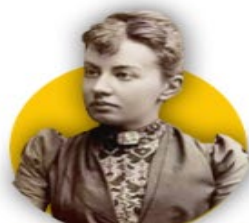
Со́фья Васи́льевна Ковале́вская